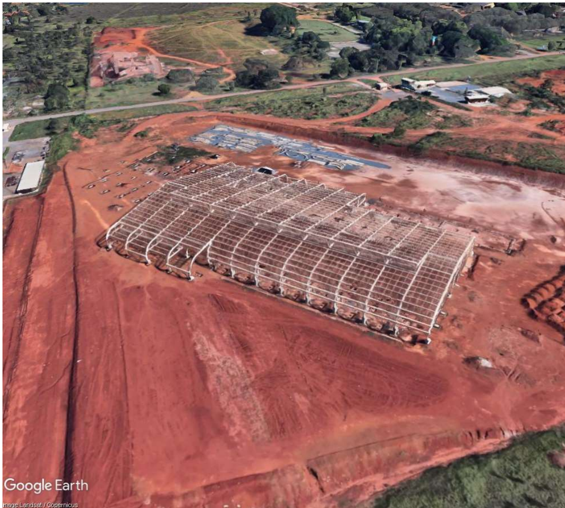
Figura 1.1 - Projeto de Urbanismo URB-045/11 - Parque das Aves - SHIP