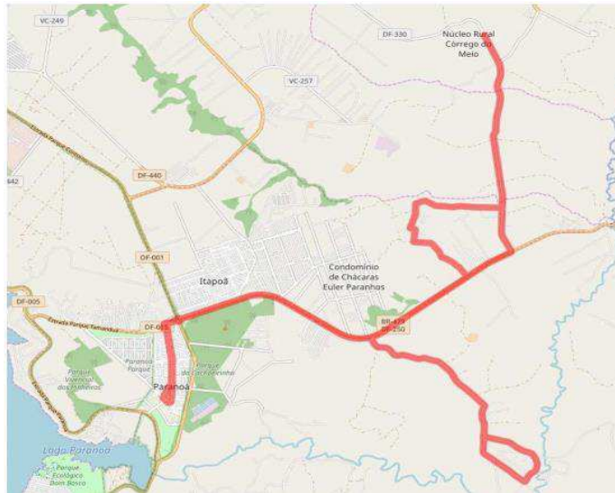
0.510 Paranoá / N. R. Córrego do Meio (Capão da Erva) / Sobradinho dos Melos